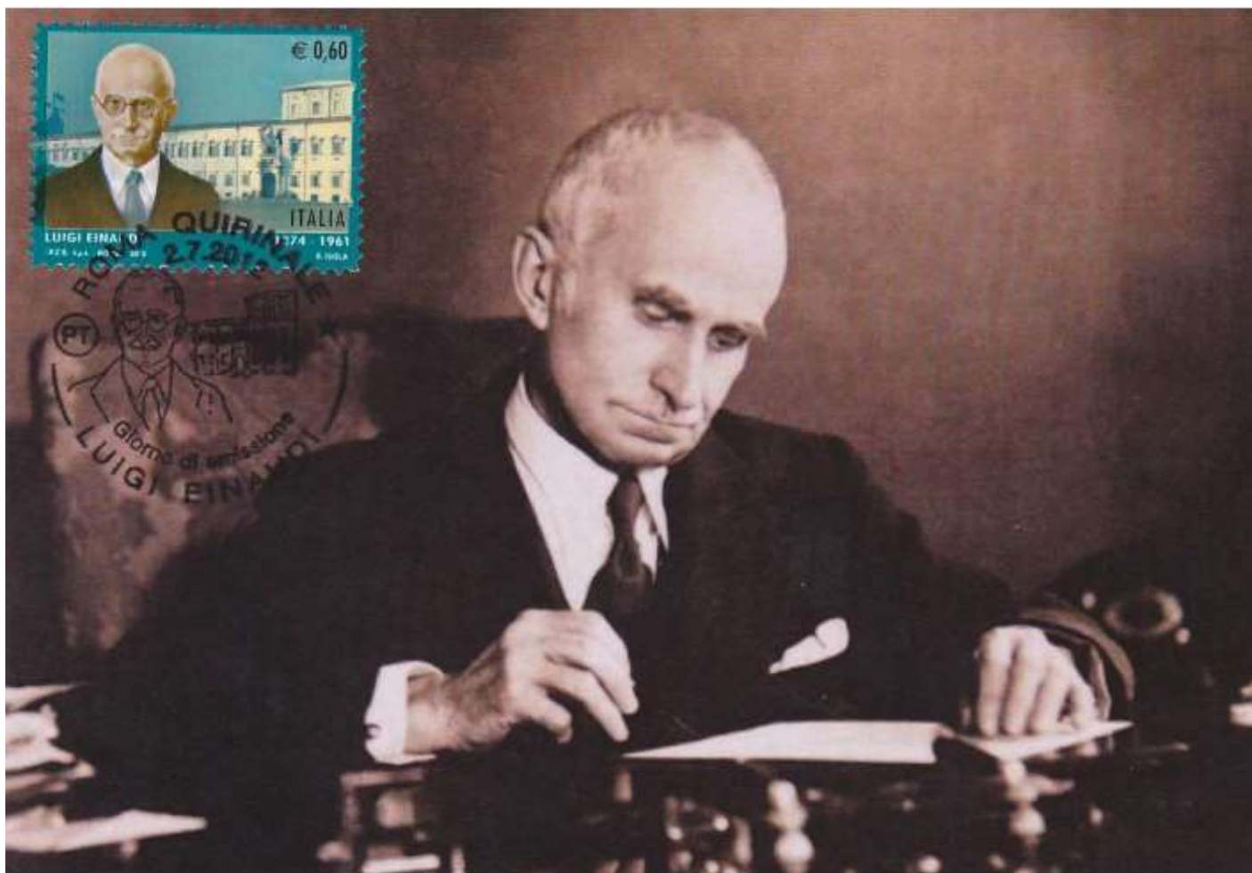
Luigi Einaudi (1874-1961) Em.02-07-2012 Italia ASI-I°G Roma Quirinale Soggetto principale