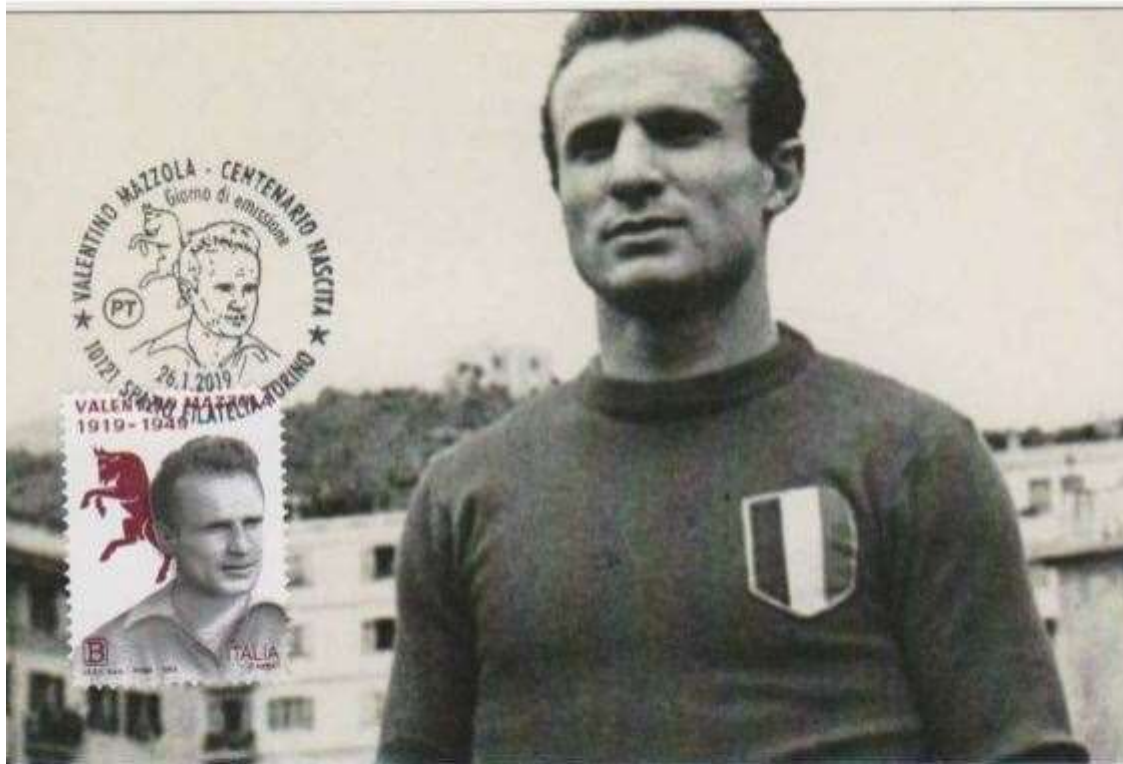
Valentino Mazzola 100° anniversario nascita Em. 26-01-2019 Italia ASI-I°G Torino Ediz. Arnaudo