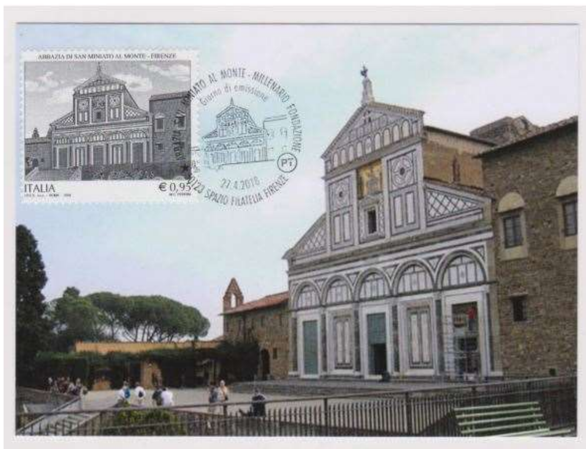
Abbazia di San Miniato al Monte- Firenze Em. 27-04-2018 Italia ASI-I°G Firenze