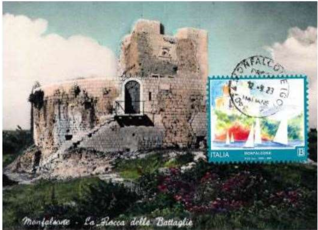
Turismo-Italia del Mare Monfalcone la Rocca della battaglia Em.11-7-2023 Italia ASI I° G Monfalcone